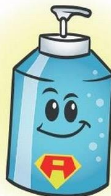
O POTENTE ÁLCOOL EM GEL